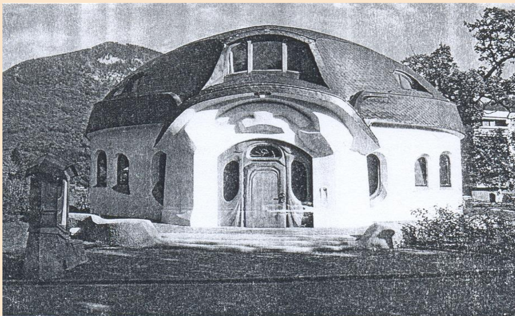
Antroposofiskās biedrības atzara māja Zalzburgā. Arhitekti: Dr.E.Hičs, M.Kcjazeks un K.Hičs

Protams, lai paskaidrotu, kā atbrīvojošo formu veidošana varētu izskatīties detaļās, būtu nepieciešams daudz smalkāk pievērsties šim jautājumam. Būtu jāpievērš uzmanība arī tam, kādā mērā noteiktas ēkas vai konstrukcijas formas atbilst tās uzdevumam: vai šī uzdevuma apzināšanās un formu pārdzīvojums cilvēka dvēselē var saplūst vienā harmoniskā veselumā. Piemēram, baznīcas formu valodai ir jābūt citādākai nekā dzīvojamās istabas vai garāžas formu valodai. Tātad no tā, kādā mērā ēkas formas atbilst tās pielietojumam vai jēgai, būs atkarīgs, cik atbrīvojoši tā iedarbosies uz cilvēka dvēseli.