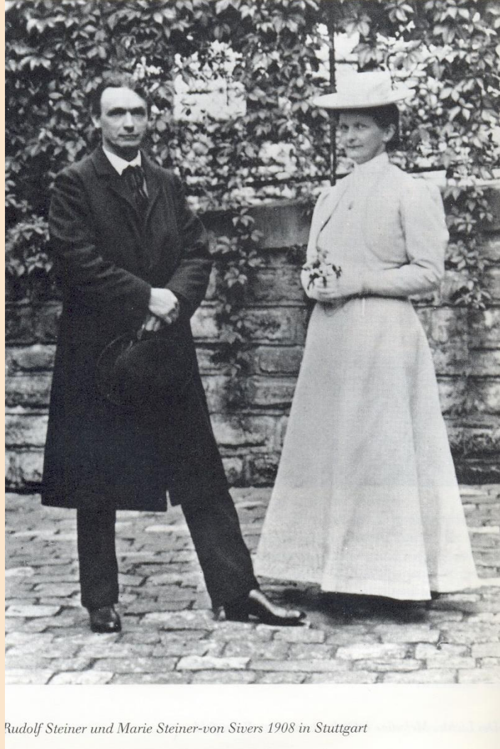
Rudolf Steiner und Marie Steiner-von Sivers 1908 in Stuttgart

Šī māksla – eiritmija – neattēlo nekādus ķermeņus kā to dara tēlotājas mākslas, tā nepauž arī nekādus dvēseliskus pārdzīvojumus kā deļa vai mūzika, kas kā kosmiska inspirācija ienāk cilvēka dvēselē; tā netver arī plūstošo laika norisi vai iekšējo dvēseles dzīvi kā dzeļa. Tā ir tieša garīgā elementa izpausme: valodas, šīs dievišķās dāvanas, kas ir devusi mums, cilvēkiem, iespēju cauraut ar garu materiālo pasauli un kas pakāpeniski dos mums iespēju apzināti uzticēties smalkākiem elementiem: gaisam, gaismai un ēterim. Tonis un toņa žests ir ceļi pie tā. Ja žests caurstrāvo skaņu, tad rodas mākslinieciska runa. Bet skaņa var radīt savu attēlu fiziskajā ķermenī, un tad tas, kas caurstrāvo gaisa dvašu kā ēterisks veidojošs spēks, pārvēršas no skaņas viļņa formētāja par fiziskā žesta formētāju. Pirmām kārtām rokas, kas neskar vis grīdu, bet satver likteni, ir spējīgas sekot šiem gaisa dwašas veidojumiem. To kustīgumā slēpjas iespēja atveidot daudzveidīgo valodas bagātību un šādi arvien vairāk apgarot ķermeni. Šādi radusies fiziskā kustība norāda uz to, kas vienlaicīgi norisinās ēteriskajā pasaulē, simtkārt metamorfizējas un tādēļ spēj ietvert sevī visu pasaules bagātību, ko aptver valoda. Cik nabadzīgs ir tam blakus gluži personīgs pārdzīvojums!